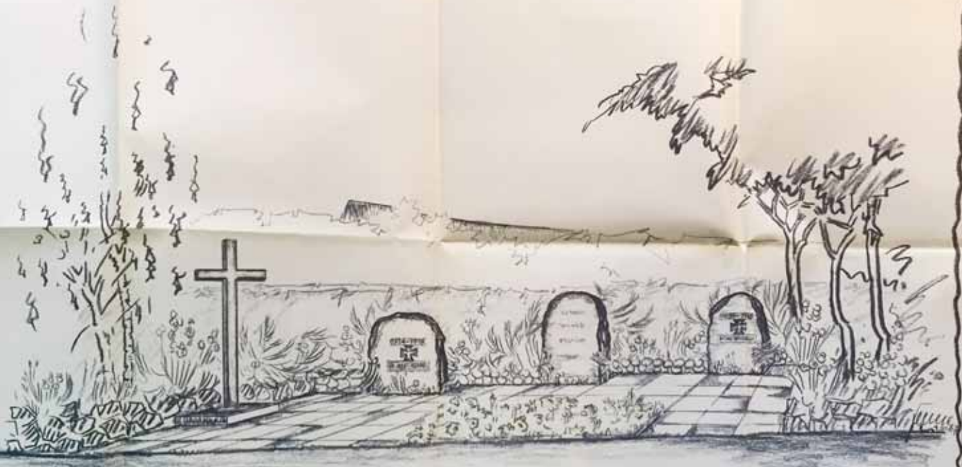
— EHRENMAL BOSAU —