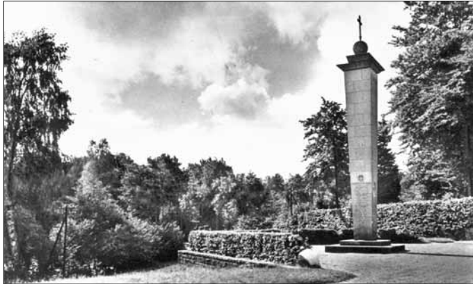
Das Denkmal um 1960

Es ist eines der würdigsten und künstlerisch schönsten im Kreisgebiet und weit darüber hinaus. Es ist am 23. August 1928 eingeweiht worden und besteht danach in diesem Jahr schon 80 Jahre. Offenbar ist es schon 1927 fertig gewesen aber zwischen diesen beiden Daten gibt es einige Unklarheiten, die nachstehend ein wenig aufgeklärt werden sollen.