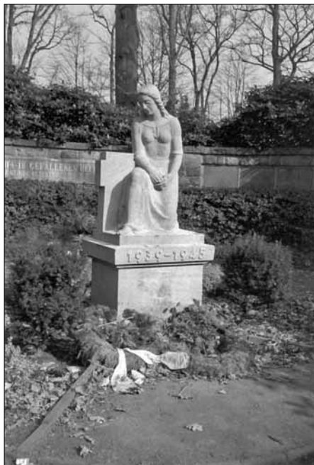
»Die Trauernde«, Ehrenmal auf dem Friedhof Bad Oldesloe

rungsarbeiten ist ein großer Findling zu tage gefördert worden, der quer über die Fläche eine schön ausgeprägte Bänderung hat. Der Stein ist am Waldreiterweg un-