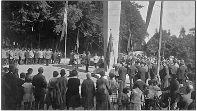
Gedenkveranstaltung am Ehrenmal

◀ sich bei den Auseinandersetzungen um einen Flaggenstreit handelt. Es heißt dort, dass die »Militärische Kameradschaft« den Kompromissvorschlag machte, außer den Reichs- (Schwarz-Rot-Gold) und Landesfarben noch die schwarz-weiß-rote Flagge mit der »Gösch« (vom Reich anerkannte Handelsflagge) zu zeigen. Das wurde vom Reichsbanner Schwarz-