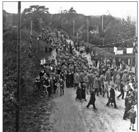
Anmarsch zur Veranstaltung?