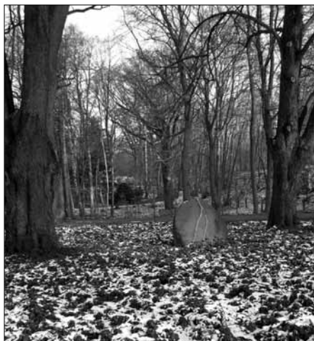
»Die goldene Wiege«

rungsarbeiten ist ein großer Findling zu tage gefördert worden, der quer über die Fläche eine schön ausgeprägte Bänderung hat. Der Stein ist am Waldreiterweg un-