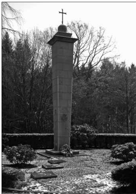
Das restaurierte Denkmal

Im Jahre 2007 wurden Schäden an dem Denkmal festgestellt, die sich bei näherer Begutachtung als schwerwiegend herausstellten. Es wurde beschlossen, das Denkmal Schicht für Schicht abzutragen, und wieder neu aufzusetzen. Das erwies sich als undurchführbar, weil das Ganze einzustürzen drohte, wenn man den Abschluss mit der Kugel und dem Kreuz abnehmen würde. Die Verantwortung dafür konnte nicht übernommen werden. Stattdessen